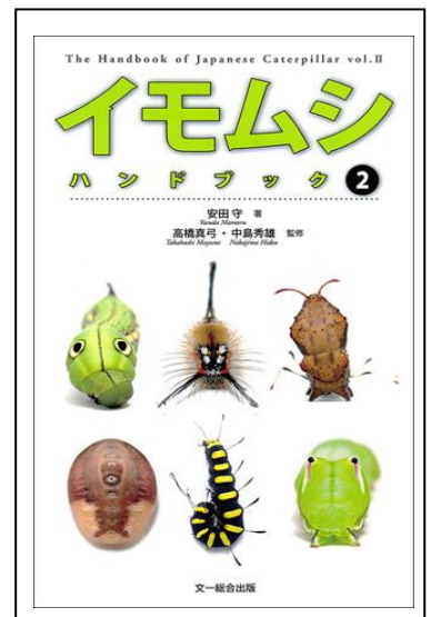
イモムシハンドブック 表紙絵2

今回の講演では、形態や生態が魅力的なイモムシを紹介しながら、イモムシとはどのような生物なのか、そもそもの由来、食性や生態の知見、観察や飼育上の実際のヒントなど、イモムシ観察をはじめるとのあたりの入門的な話ができればと考えています。